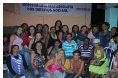
TOPA- Programa de Alfabetização

A cidade de Canudos ficou conhecida pelo movimento messiânico de Antônio Conselheiro que atraiu milhares de pessoas para a luta contra a miséria e a fome da população rural da região na antiga república.