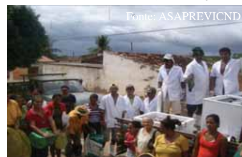
Entrega de peixes (CONAB)